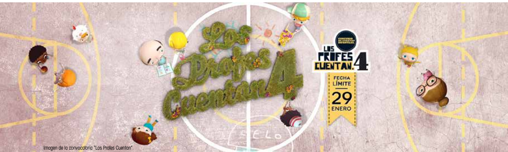
Imagen de la convocatoria "Los Profes Cuentan".

En 2013, Ecoembes puso en marcha con la Secretaría General de Instituciones Penitenciarias dos programas dirigidos a la formación en gestión y tratamiento de residuos y a la inserción sociolaboral en empresas del