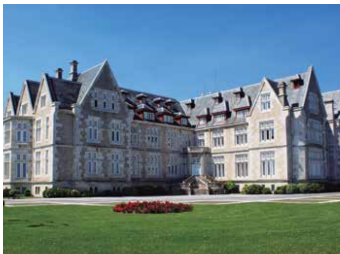
Palacio de La Magdalena.

El Alcalde de Santander y Presidente de la Red Española de Ciudades Inteligentes estará en la sesión inaugural y también en la clausura del foro. Íñigo de la Serna ha hecho un llamamiento a las empresas locales para que participen y "tomen conocimiento de los últimos avances en materia de ciudades inteligentes".