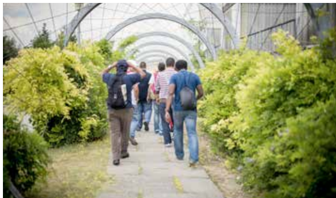
Ecoembes e Instituciones Penitenciarias colaboran para facilitar la reinserción laboral de reclusos.

El objetivo de este proyecto es que los 15 alumnos participantes adquieran conocimientos para facilitar su inserción sociolaboral y el acceso a puestos de trabajo en el sector de la recuperación y reciclaje de los envases.