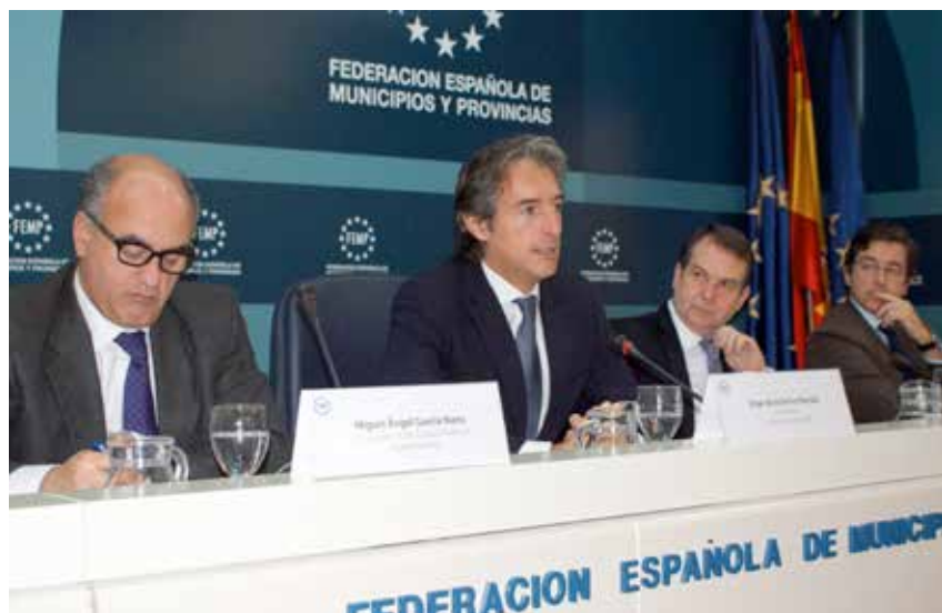
Intervención del Presidente durante el Consejo Territorial.

La situación actual de implantación de la factura electrónica en la Administración Local española ha mejorado sensiblemente en el último año, aunque aún precisa de refuerzo mediante acciones de difusión y/o de promoción. Así se extrae de los resultados obtenidos en la encuesta realizada por la FEMP entre el conjunto de las Entidades Locales españolas para conocer este extremo y, al mismo tiempo, difundir la obligatoriedad de aceptar las facturas