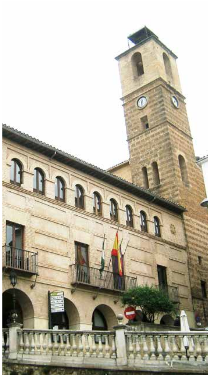
Ayuntamiento de Cazória (Jaén)

En este mismo foro de la CNAL fue atendida otra de las propuestas de la FEMP, incluidas en el lote de enmiendas a los Presupuestos, de flexibilización de la devolución del saldo deudor de la liquidación negativa del ejercicio 2013. Como pedía la Federación, este reembolso podrán hacerlo los Ayuntamientos en las mismas condiciones que los correspondientes a los años 2008 y 2009, es decir a 10 años y en 120 mensualidades.