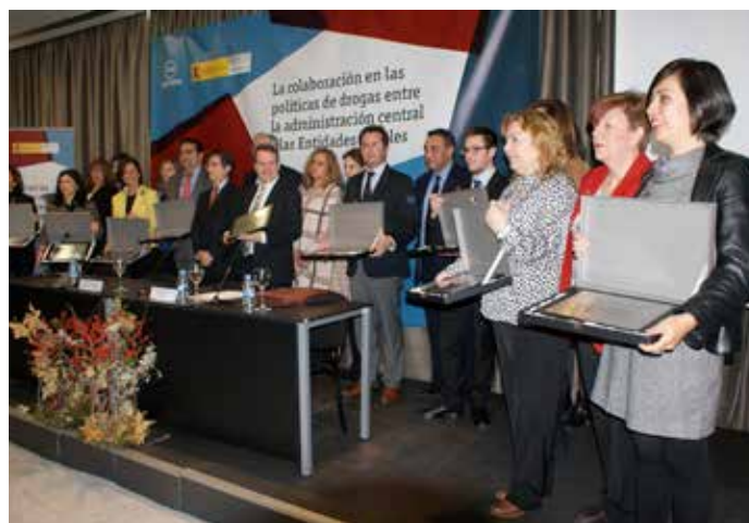
Los premiados posan tras recibir los galardones.

En el apartado de estrategias y planes de prevención, los tres premiados han sido el Ayuntamiento de Vigo, la Diputación Provincial de Huelva, y el Ayuntamiento de Santa Coloma de Gramanet (Barcelona).