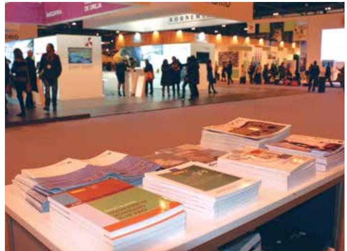
Imagen de FITUR 2014 desde el Stand de la FEMP.

Mejor Administración Pública colaboradora , un premio que destaca el apoyo prestado por las Administraciones como elementos vertebradores, impulsores, dinamizadores y de apoyo en favor del buen desarrollo del SICTED en su territorio. La adhesión e implantación del sistema se lleva a cabo en el marco de un convenio con la Comunidad Autónoma, o en su defecto con la Diputación Provincial, a la que pertenece el destino.