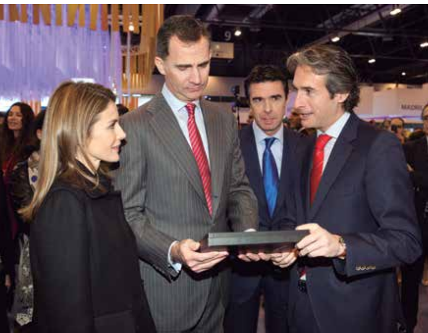
El Presidente de la FEMP, con los Reyes y el Ministro de Industria, Energía y Turismo, en FITUR 2014.

La edición del pasado año de FITUR acogió a más de 9.000 empresas expositoras y en sus pabellones lucieron sus banderas y propuestas turísticas 165 países – regiones. La presencia de medios de comunicación fue numerosa, con más de 7.000 periodistas acreditados de 60 países.★