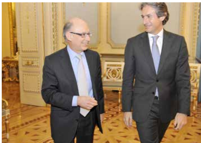
Cristóbal Montoro con Íñigo de la Serna antes de comenzar la reunión de la CNAL.

Gracias al esfuerzo presupuestario de las Entidades Locales –tal y como se reconoce desde el Ministerio de Hacienda y Administraciones Públi-