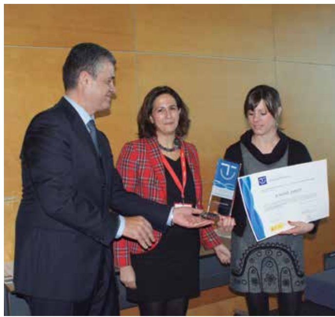
El Presidente de la Comisión de Turismo de la FEMP, con la Secretaria de Estado de Turismo y una de las galardonadas con los diplomas SICTED del año pasado.