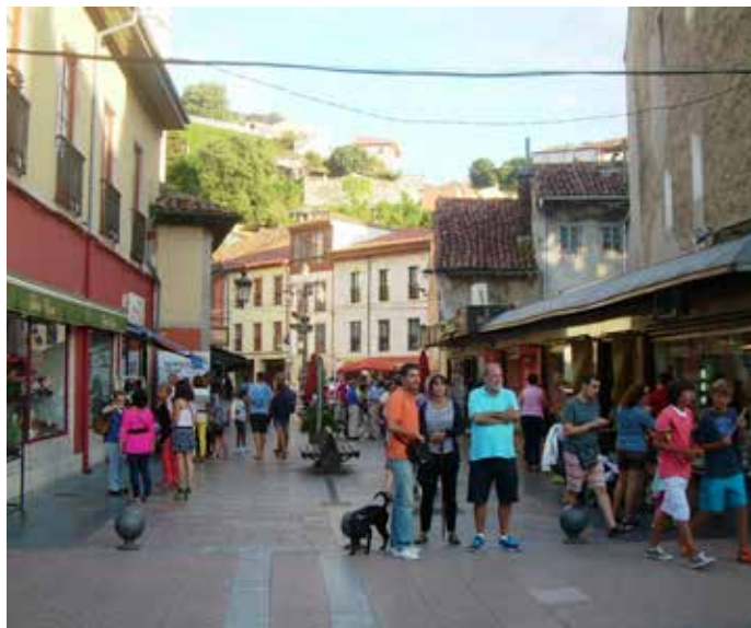
Con la Red, las Entidades Locales se pondrán a la vanguardia en transparencia.

Asimismo se recordó que, dado que el Pleno Ordinario ha de ser convocado por el Presidente, previo acuerdo de la Junta de Gobierno, y que la convocatoria ha de ser realizada, al menos, con sesenta